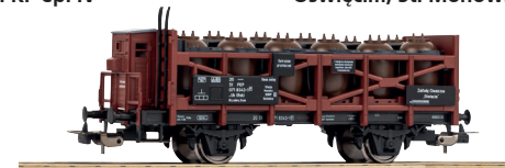
# 24516 Wagon kwasniarka PKP, St. Monowice, DOKP Katowice, ep. IV