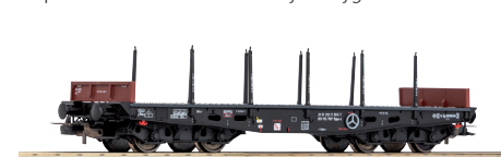
# 58414 Wagon platforma z kłonicami 401Ze Rpps-x PKP ep. IV

Odpowiednie dodatki do wiernych oryginałów składów pociągów: