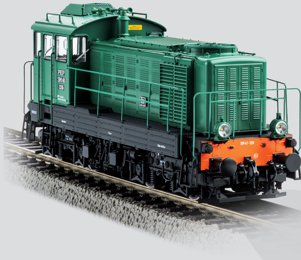
Lokomotywa spalinowa SM41 PKP

Mocny partner w pracy manewrowej SM41 w skali 1:87