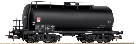
# 24515 Wagon cysterna Uah (RRh) Zak. Chem. Oświęcim, St. Monowice, Dyr. Katowice, PKP ep. IV