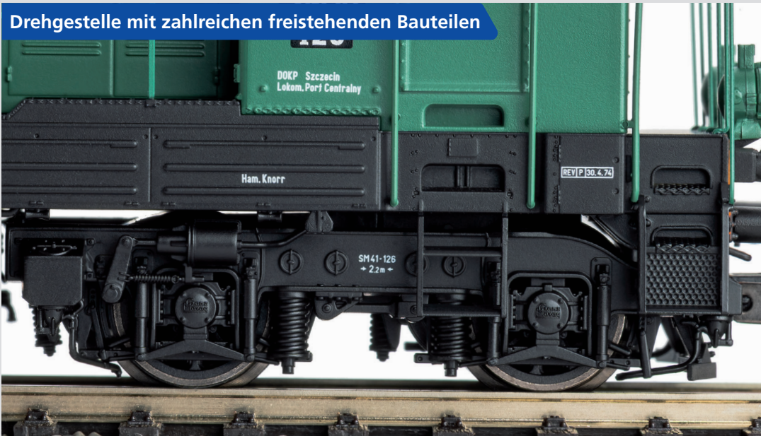
Drehgestelle mit zahlreichen freistehenden Bauteilen