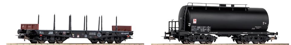
# 58414 Rungenwagen 401Z PKP Ep. IV

Passende Ergänzungen für originalgetreue Zugbildungen: