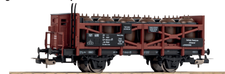
# 24516 Säuretopfwagen PKP Ep. IV