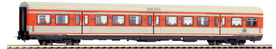
58500 Personenwagen x-Wagen 2. Klasse DB Ep. IV 49,99 €*

Mit den attraktiven PIKO Modellen der BR 111 (DC #51844 / AC #51845) stehen ideale Lokomotiven für die originalgetreue Nachbildung realistischer S-Bahn-Züge der Bundesbahn in der Epoche IV zur Verfügung!