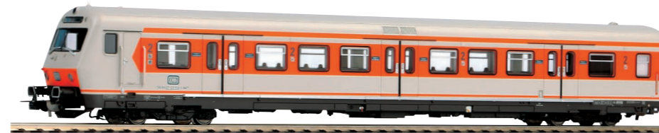
58501 Personenwagen x-Steuerwagen 2. Klasse DB Ep. IV 74,99 €*

Zusätzlich zu den reinen Sitzwagen mit 24,5 m Länge wurden von Beginn an auch passende Steuerwagen für die S-Bahn Wendezüge geordert. Diese besitzen bei einer Länge von 25,26 m eine Leermasse von 31.100 kg. Insgesamt wurden mit der Vorserie und den vier Serienlieferungen 118 Steuerwagen an die S-Bahnen Rhein-Ruhr und Nürnberg ausgeliefert, die zusammen mit den reinen Sitzwagen jeweils eine Zuginheit bilden. Die Steuerwagen besitzen einen DB-Einheitsführerstand und eine zeitmultiplexe Wendezugsteuerung über die UIC-Leitung der Wagen und der Lok. Im Gegensatz zu den Sitzwagen mit vier Großräumen, verfügt der Steuerwagen über drei Großräume.