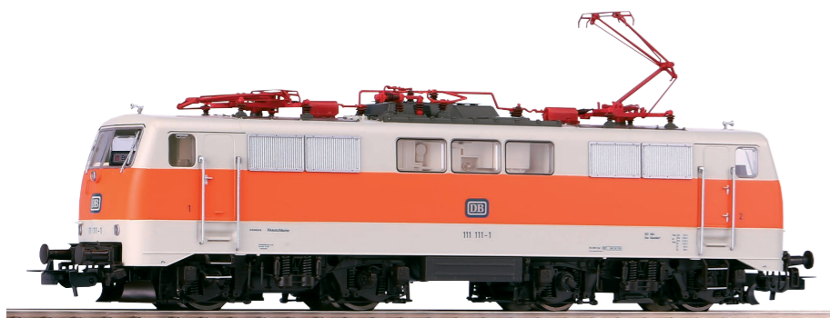
51844 Elektrolok BR 111 S-Bahn Rhein-Ruhr DB Ep. IV 159,99 €* 51845 ~ Elektrolok BR 111 S-Bahn Rhein-Ruhr DB Ep. IV 199,99 €*