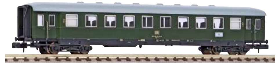
40620 Carrozza espresso con carenatura di 2 cl. delle DB Ep. IV