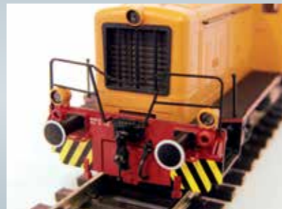
frontale con radiatore