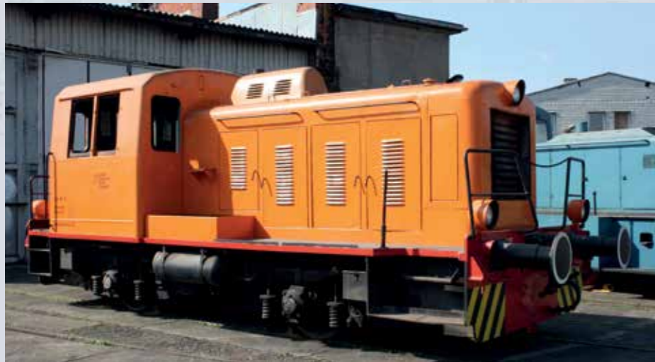
Locomotiva al deposito della stazione merci di Sonneberger

Nei primi anni Sessanta, la Fabbrica Macchine Kaluga, in Russia, sviluppò la locomotiva Diesel a due assi TGK2, a trasmissione idraulica. Tali robuste macchine vennero messe e sono a tutt'oggi in servizio su raccordi industriali e per servizi di manovra. Questo gruppo venne costruito, in varie serie e versioni, in oltre 9000 esemplari e, oltre alla variante russa TGK2-M, fu anche prodotto nella versione TGK2-E, destinata all'estero. Di quest'ultima, 184 esemplari vennero forniti all'ex Repubblica Democratica Tedesca, per servizi in stabilimenti industriali e ad altri veicoli in Cecoslovacchia e Polonia. La locomotiva N. 2, negli Stabilimenti Elettrocaramici Nazionalizzati di Sonneberg. Oggi, una serie di queste locomotive sono in tutto il territorio dell'ex Unione Sovietica e in parte anche in Germania sono in uso nelle ferrovie delle fabbriche. In Germania sono stati conservati diversi veicoli, tra cui la locomotiva n. 2 qui sopra, che è stata utilizzata per l'ultima volta nel VEB Elektrokeramische Werke a Sonneberg e che può essere visitata ancora oggi nella locale stazione.