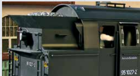
cabina di guida con figura del macchinista