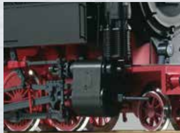
ruote in acciaio inossidabile