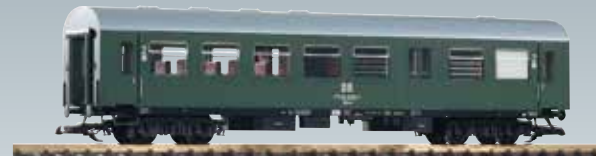
37651 Carrozza Reko BDghwse 2a classe con bagagliaio delle DR Ep. IV