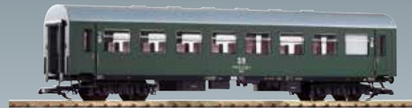
37650 Carrozza Reko Bghwe 2a classe delle DR Ep. I