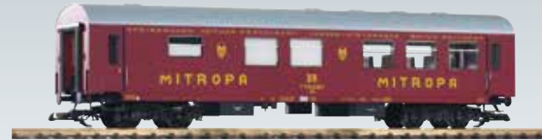
37652 Carrozza Ristorante Reko WRge „Mitropa“ delle DR Ep. IV