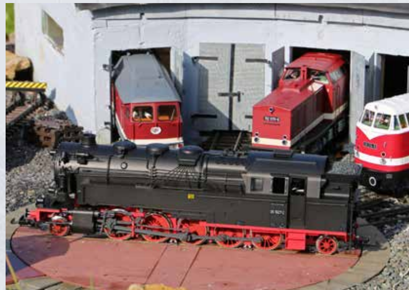
La BR 95 sulla piattaforma girevole davanti alla rimessa