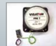
36228 Decoder Sound per locomotiva a vapore BR 95