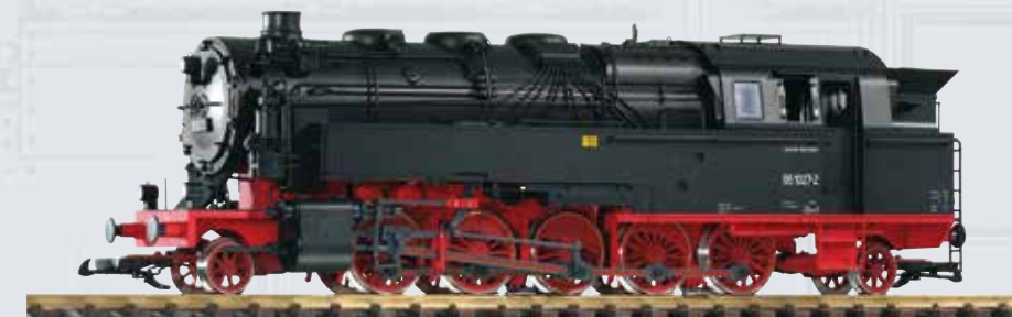
37230 Locomotiva a vapore BR 95 delle DR Ep. IV-V

Il suono reale è ben riprodotto dal Sound decoder #36228 della PIKO abbinato al decoder PIKO n. 36122. L'art. 36017 per l'illuminazione della cabina può essere montato successivamente.