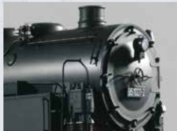
corrimani extra inclusi

Locomotiva a vapore BR 95 - la leggendaria „Regina delle montagne“ modello PIKO per i treni da giardino